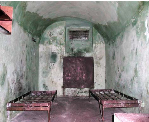
Камера смертников. Фотографии сделаны в 2003 году